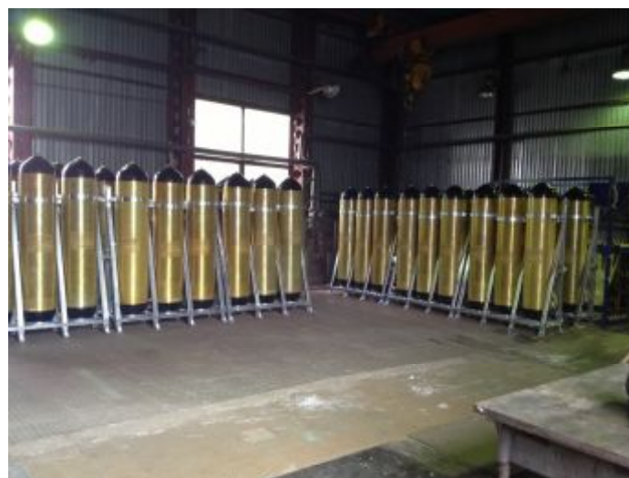
Блоки баллонов БСЖО в сборочном цехе