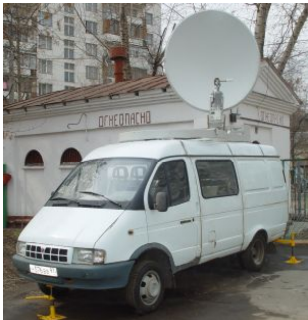
АС \Phi 1,66м на автомобиле

АС изготавливаются по ТЗ заказчика для диапазонов С и Ku.