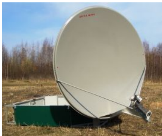
АС \Phi 1,66м контейнерного исполнения