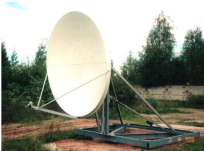
АС \Phi 2,4м стационарного исполнения