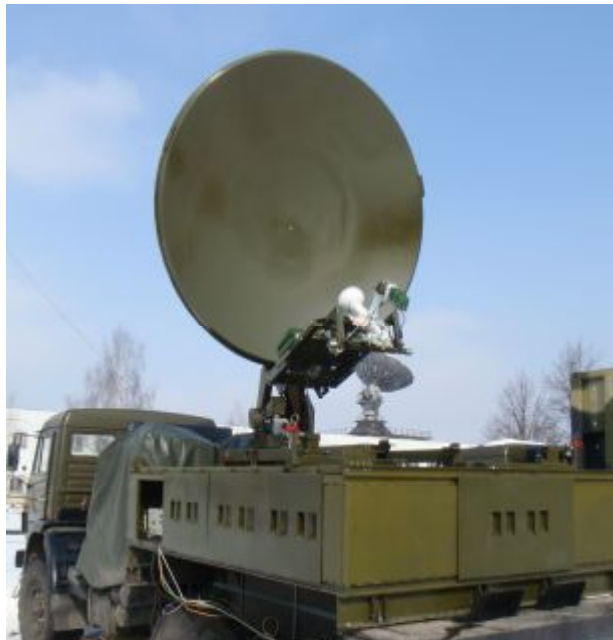
АС \Phi 2,4м на автомобиле